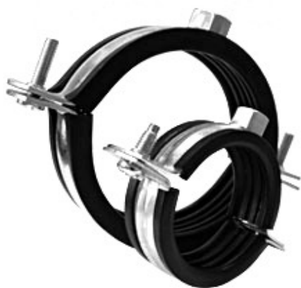
Трубные хомуты FRS